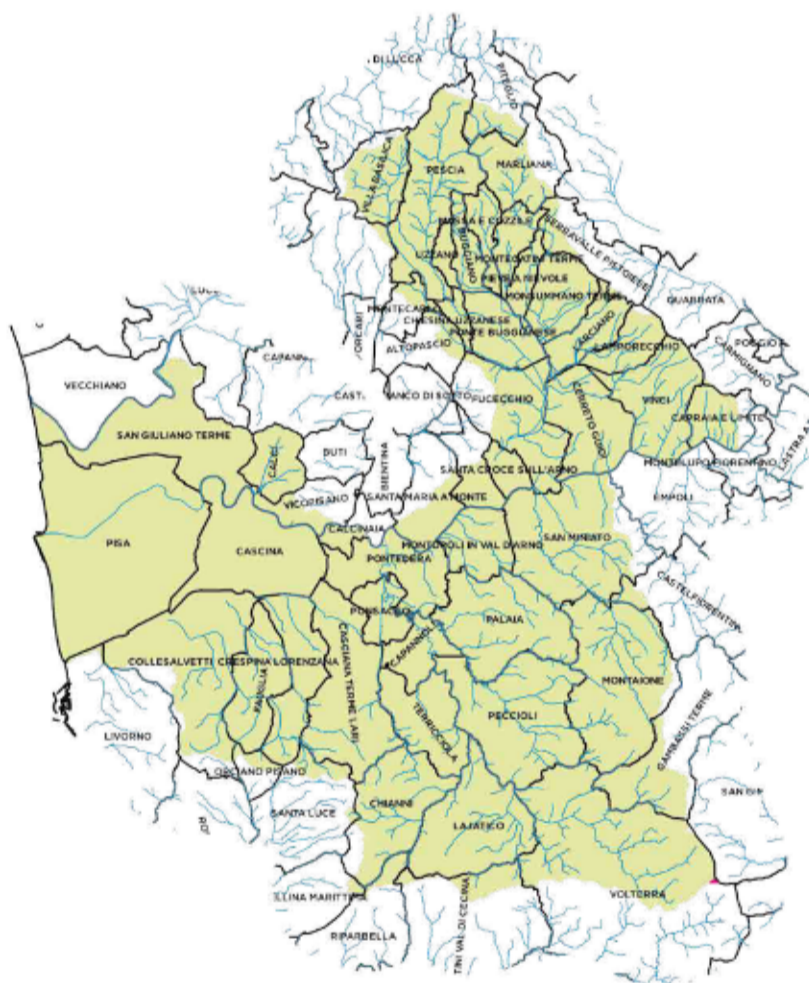
In verde il territorio del Consorzio